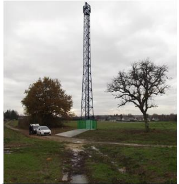
Photomontage du projet qui préfigure l'implantation du pylône une fois les travaux réalisés

Une fois le pylône implanté, les quatre opérateurs (Bouygues Télécom, SFR, Orange et Free) auront l'obligation d'y installer leurs antennes relais pour permettre la couverture mobile de la commune en 4G.