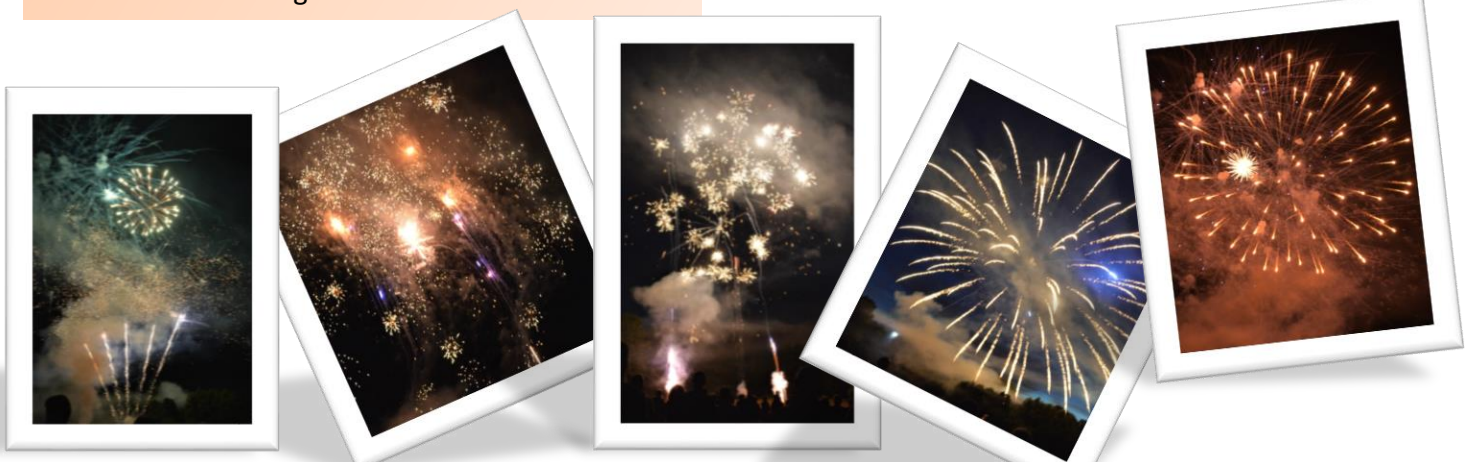
Feu d'artifice intercommunal, tiré le 15 juillet 2017 à l'Espace de Vienne à Chemillé sur Dême